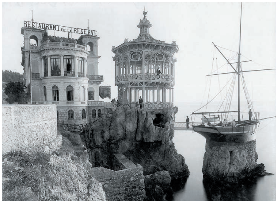
La Réserve vers 1900