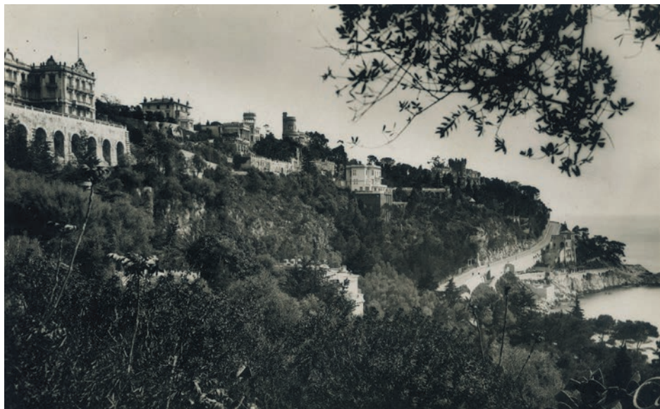
Les villas du Mont-Boron