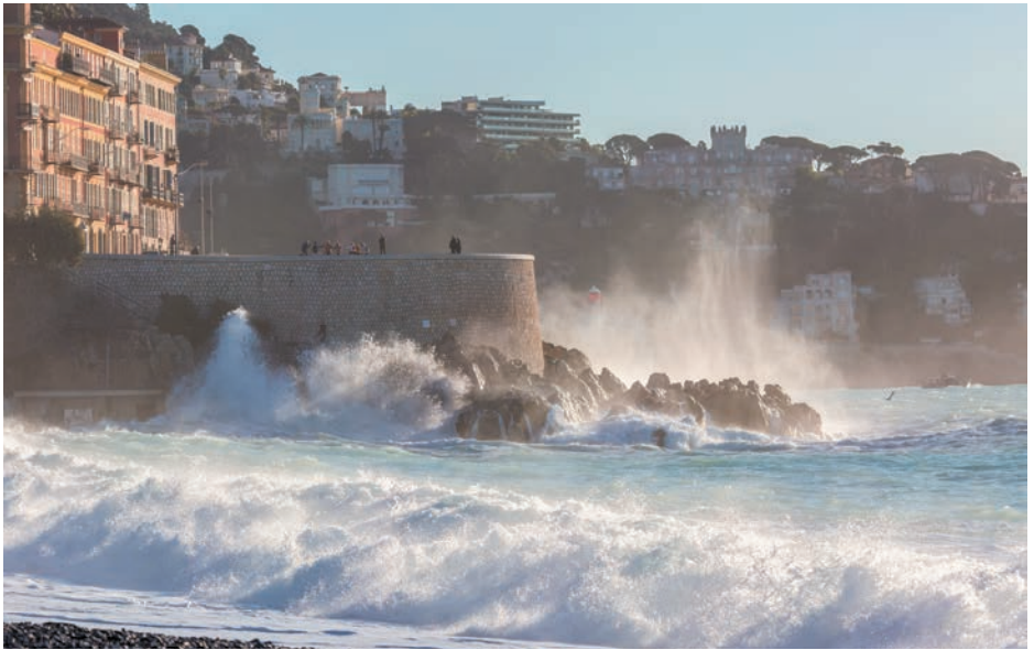
Tempête à Rauba Capèu