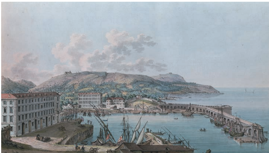
Le port de Nice à Lympia vers 1782, gravure aquarellée d'Albanis Beaumont, Voyage historique et pittoresque au comté de Nice. Genève, 1785