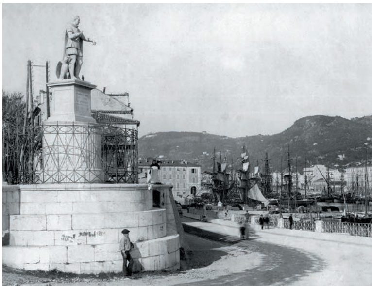
La statue du roi Charles-Félix dominant le port