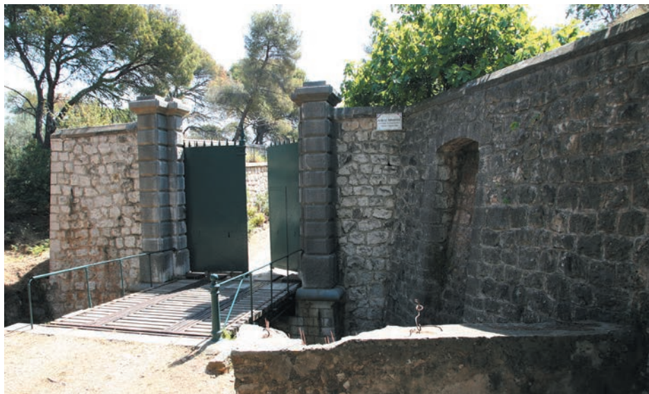
Entrée de la batterie du Mont-Boron