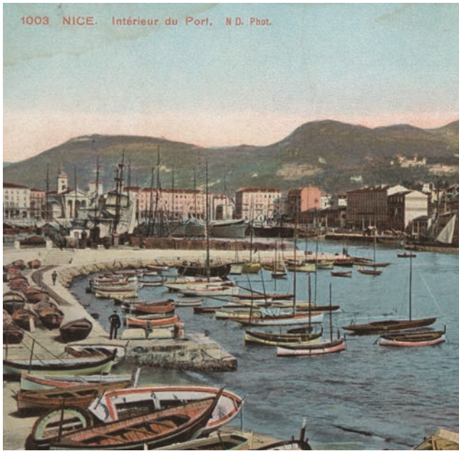
1003 NICE. Intérieur du Port, N.D. Phot. L'intérieur du port de Nice et les entrepôts, carte postale colorisée, Lévy-Neurdein, début XX e (Service des Archives Nice Côte d'Azur).

libérée du ghetto, le quartier connaît une croissance rapide. Cet élan est cependant brisé par les troubles révolutionnaires et le blocus maritime mis en place par les Anglais. L'anse des Ponchettes n'abrite plus au début XIX e que des barques de pêcheurs, le port Lympia ne possède qu'un petit bassin et un embryon de grand bassin.