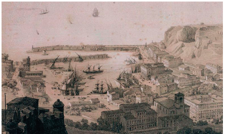
Vue prise au-dessus de Mont-Alban en 1860, lithographie d'après un dessin d'Alfred Guesdon

À partir de 1781, le nouveau quartier Lympia prend forme sur un modèle géométrique. Il est relié à la route de Turin par la rue Ségurane et s'articule autour de deux grandes places : la place Victor (aujourd'hui Garibaldi), achevée en 1790, et la future place Ile-de-Beauté. Encouragé par le roi, dopé par l'élargissement des franchises et le dynamisme économique de plusieurs familles (comme les Colombo) de la communauté juive niçoise