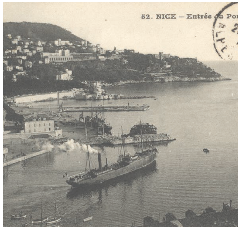
Bateau à vapeur entrant dans le port, carte postale Gilletta, avant 1914 (Service des Archives Nice Côte d'Azur).

Bientôt, le port sera le terminus de la ligne Ouest-Est du tramway de Nice.