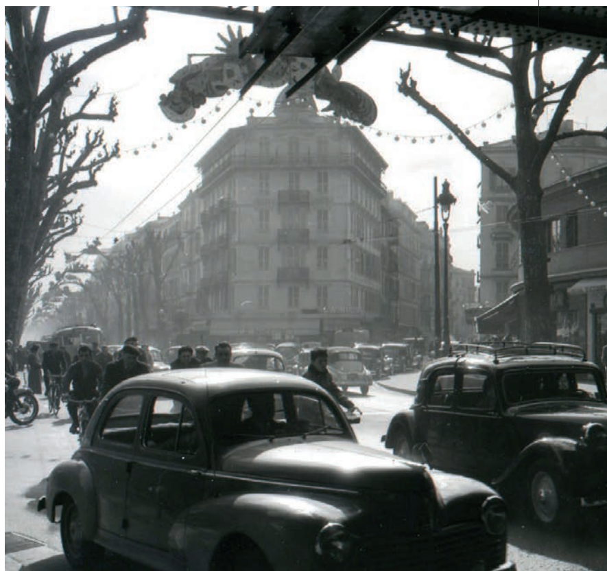
Le carrefour Thiers-Victoire, février 1957 (photographie Service photographique de la Ville, Archives municipales de Nice).

En 1933, les travaux de l'avenue Auber sont en voie d'achèvement. D'autres grands travaux vont marquer le quartier comme ceux du carrefour Thiers-Guiglia-Clemenceau et l'ouverture au printemps 1974, sous les terrains de la gare, de deux tunnels reliant le quartier des musiciens au quartier Saint-Etienne. Beaucoup plus tard, l'ensemble immobilier de l'avenue Thiers « Grand Central », comprenant un hôtel et une résidence hôtelière avec 580 places de parking, livré en 1991.