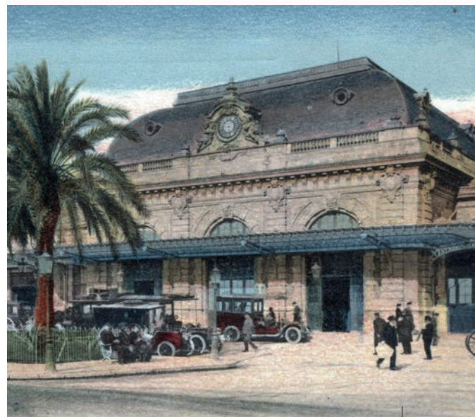
La gare PLM, carte postale début XX e

C'est, en effet, la ville qui très vite vient entourer la gare. Achevé en 1867, le bâtiment a été construit sur trois cents mètres de longueur. Le grand corps du bâtiment central,