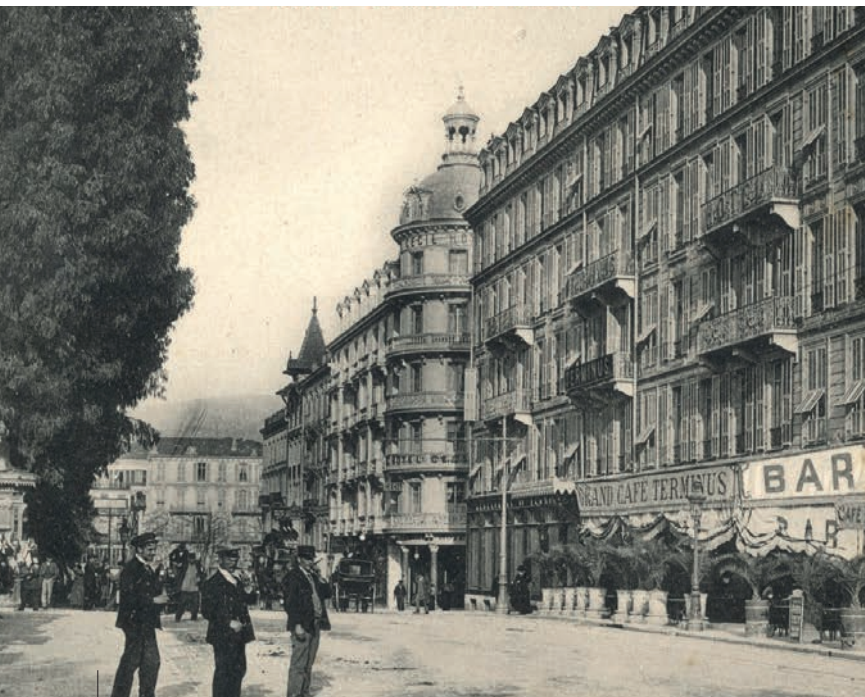
Le Grand Hôtel Terminus, avenue Thiers, carte postale début XX e