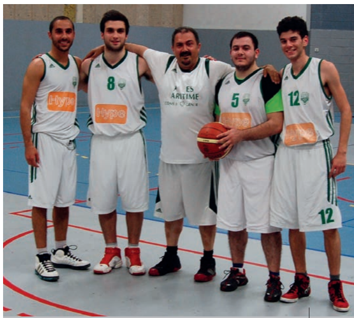
Equipe Sénior Masculin USA Arménienne de Nice 2014

Union Sportive Arménienne de Nice - 280, boulevard de la Madeleine a2ermis@aol.com ou norbert.sahakian@wanadoo.fr