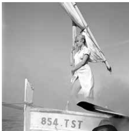
Brigitte Bardot sur le bateau

« Mirkine par Mirkine » au Musée Masséna jusqu'au 15 mai www.nice.fr