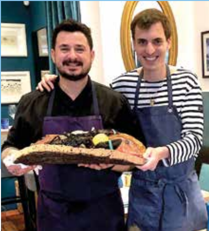
▲ Bistrot Marin , 11 bis, rue Grimaldi 04 97 20 55 36 Bar Marin , 04 97 20 55 37