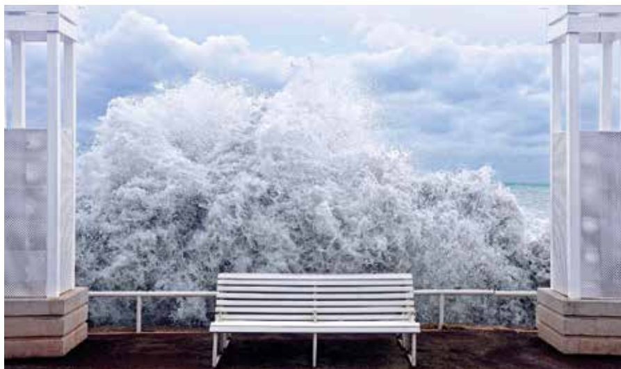
La Vague du 18 novembre 2011