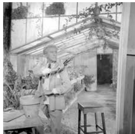
Jean Cocteau dans le Testament d'Orphée