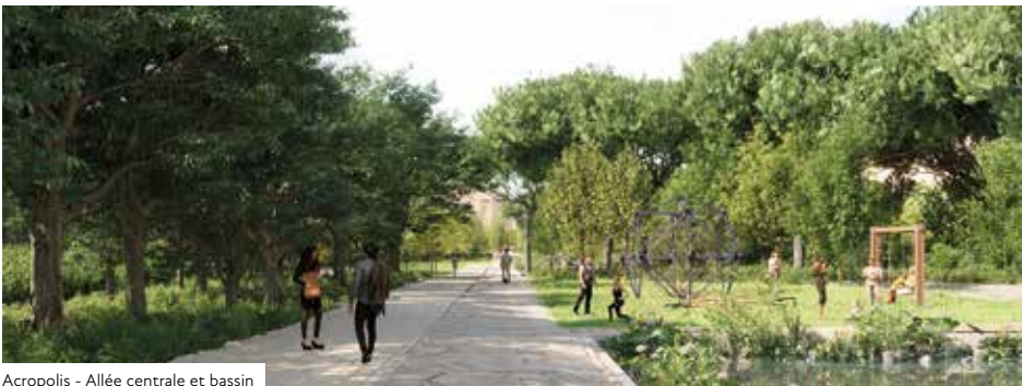
Acropolis - Allée centrale et bassin

Le postulat ? Redonner à Nice son paysage exceptionnel. Avec 36 hectares d'espaces verts supplémentaires depuis 2008, la ville-jardin s'est engagée dans une métamorphose. Encouragée par le succès de la première phase de la Promenade du Paillon et ses 12 hectares de verdure, la municipalité souhaite prolonger ce poumon vert jusqu'au Palais des Expositions afin de poursuivre l'ouverture. Redéfinir les anciennes lignes du paysage urbain, en dessiner de nouvelles pour rouvrir vers le grand paysage et bâtir un art de vivre au sein d'un même écosystème dont les objectifs sont d'améliorer la qualité de vie, protéger la biodiversité et favoriser le bien-être des Niçois.