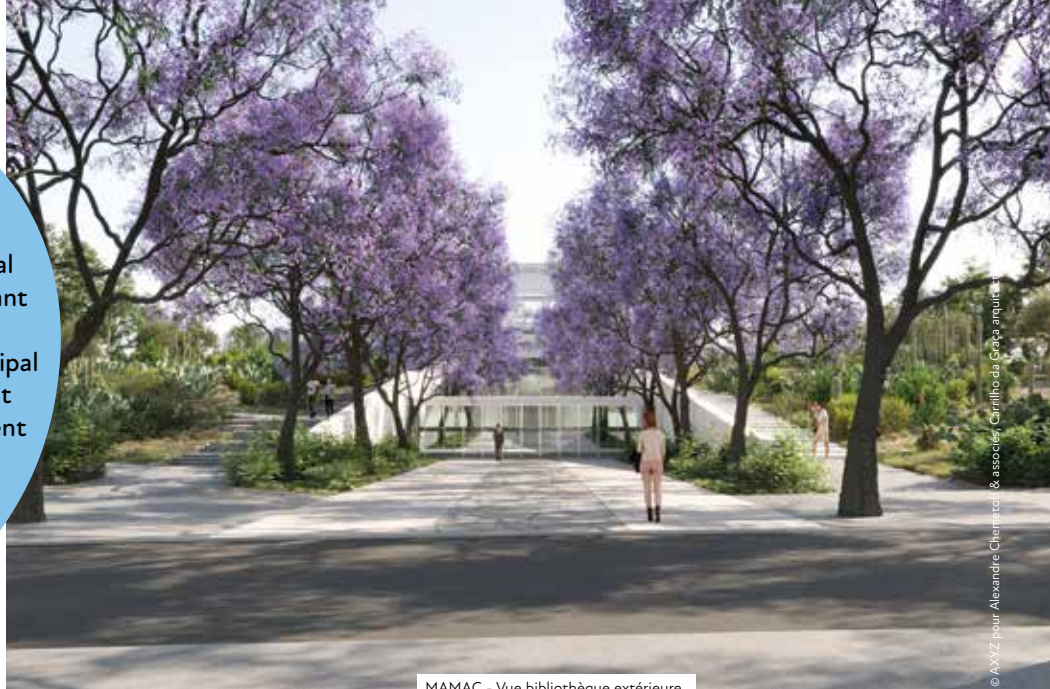
MAMAC - Vue bibliothèque extérieure

C'est le nombre de visiteurs qui foulent, chaque année, la Promenade du Paillon.