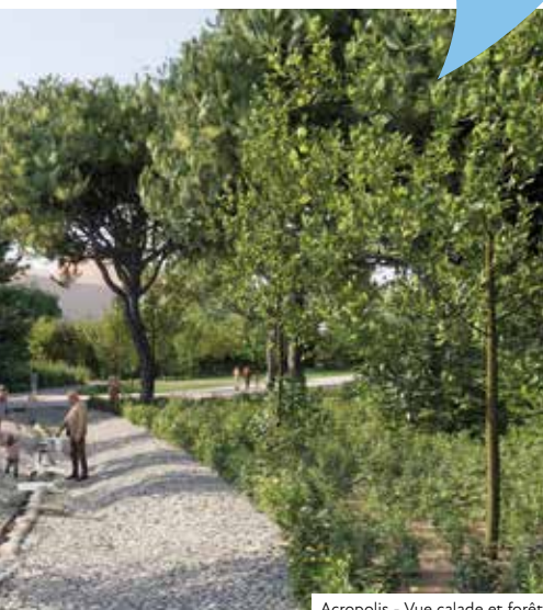
Acropolis - Vue calade et forêt

Jeudi 17 février dernier, le tribunal administratif a rejeté le référé visant à suspendre l'exécution de la délibération du conseil municipal du 10 décembre 2021 approuvant la désaffectation et le déclassement par anticipation du bâtiment et approuvant sa démolition.